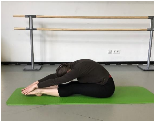
4) Langsitz mit Oberkörper auf den Beinen