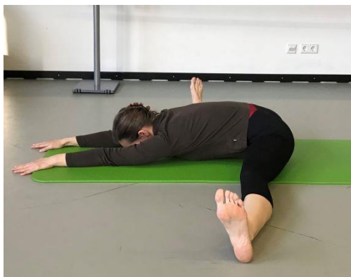
6) Spagat écarté mit Füßen flex und Oberkörper Richtung Boden